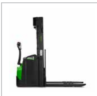
CESAB S215-220, S215L-220L