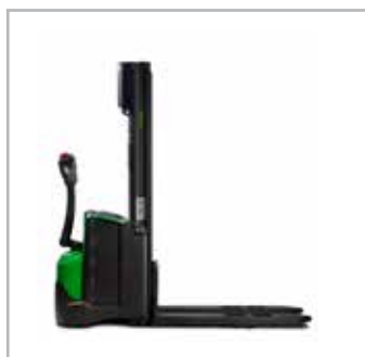
CESAB S210-214, S208L-214L, S220D